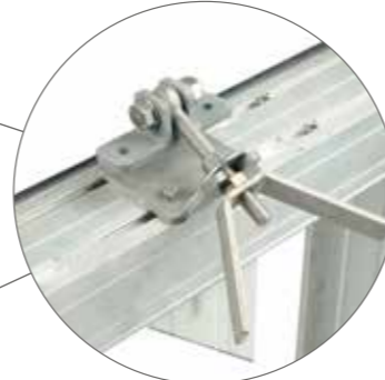
Aksesuarların yerlerinin değişebiliyor olması