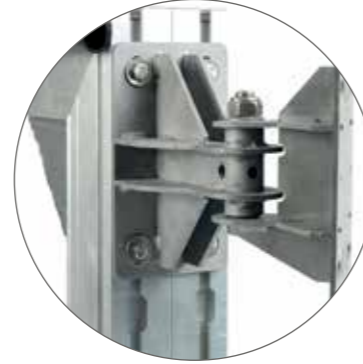
Ağır iş menteşeleri