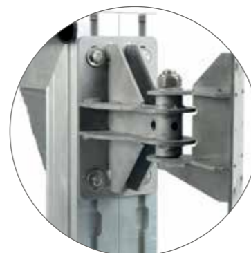
Bisagras de trabajo pesado