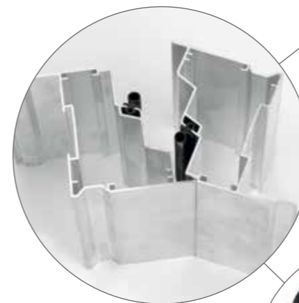
Juntas de goma EPDM